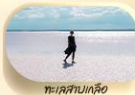
ทะเลสาบเกลือ