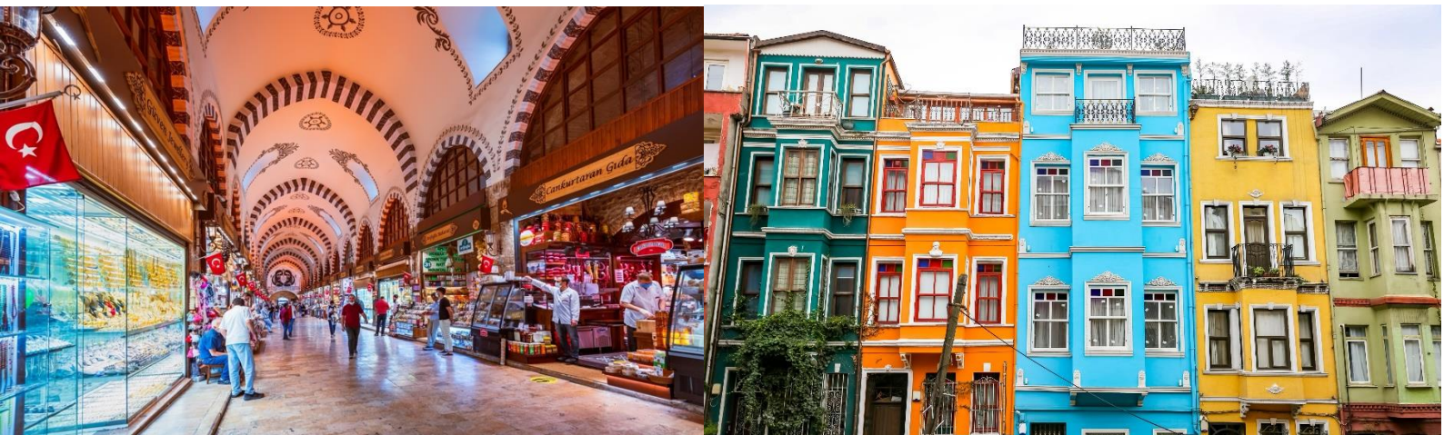
ท่องเที่ยวยอดนิยม ดึงดูดนักท่องเที่ยวจากทั่วโลก

เที่ยง อิสระอาหาร เที่ยงตามอริยาศัย เพื่อเป็นการไม่รบกวนเวลาช้อปปิ้งของท่าน นำท่านเดินทางสู่ ตลาดแกรนด์บาร์ซ่า (Grand Bazaar) เป็นหนึ่งในตลาดในร่มที่ใหญ่ที่สุดและเก่าแก่ที่สุดในโลก ภายใต้หลังคาที่ยาวไม่มีที่สิ้นสุด คุณจะพบกับกระเบื้องระยิบระยับ เครื่องเทศและงานหัตถกรรมต่างๆ นำท่านเดินเล่น ย่าน Balat Old Houses ย่านที่เต็มไปด้วยบ้านไม้สีสดใส โบสถ์ มัสยิด และร้านค้า ย่านนี้มีประวัติศาสตร์ยาวนาน เคยเป็นที่อยู่อาศัยของชาวยิว กรีก และอาร์เมเนีย ปัจจุบันย่านนี้กลายเป็นสถานที่